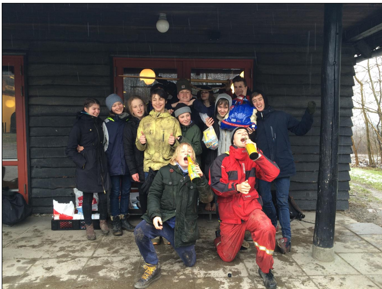
Tadaa: Vinderne af det hele!!!