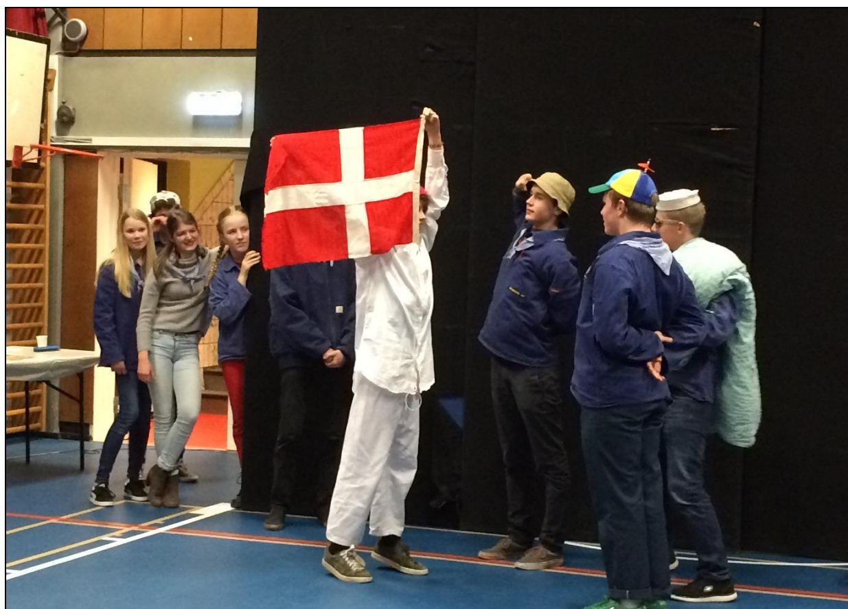
Forskellen på landspejdere og søspejdere