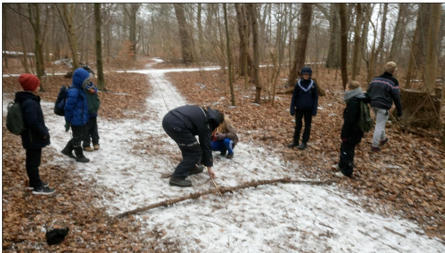
Nøjagtig opmåling på nytårsturen!