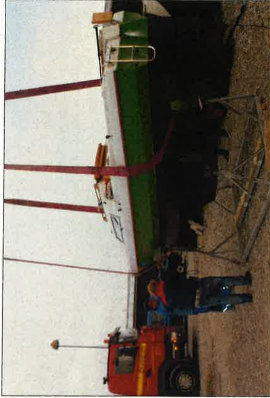
Søszætning 2. påskedag – spejdernes nye svendborgjolle

Husk i maj: 20.5.: Standerhejsning Se vedlagte indbydelse