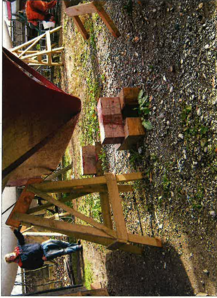
Chresten K letter ...