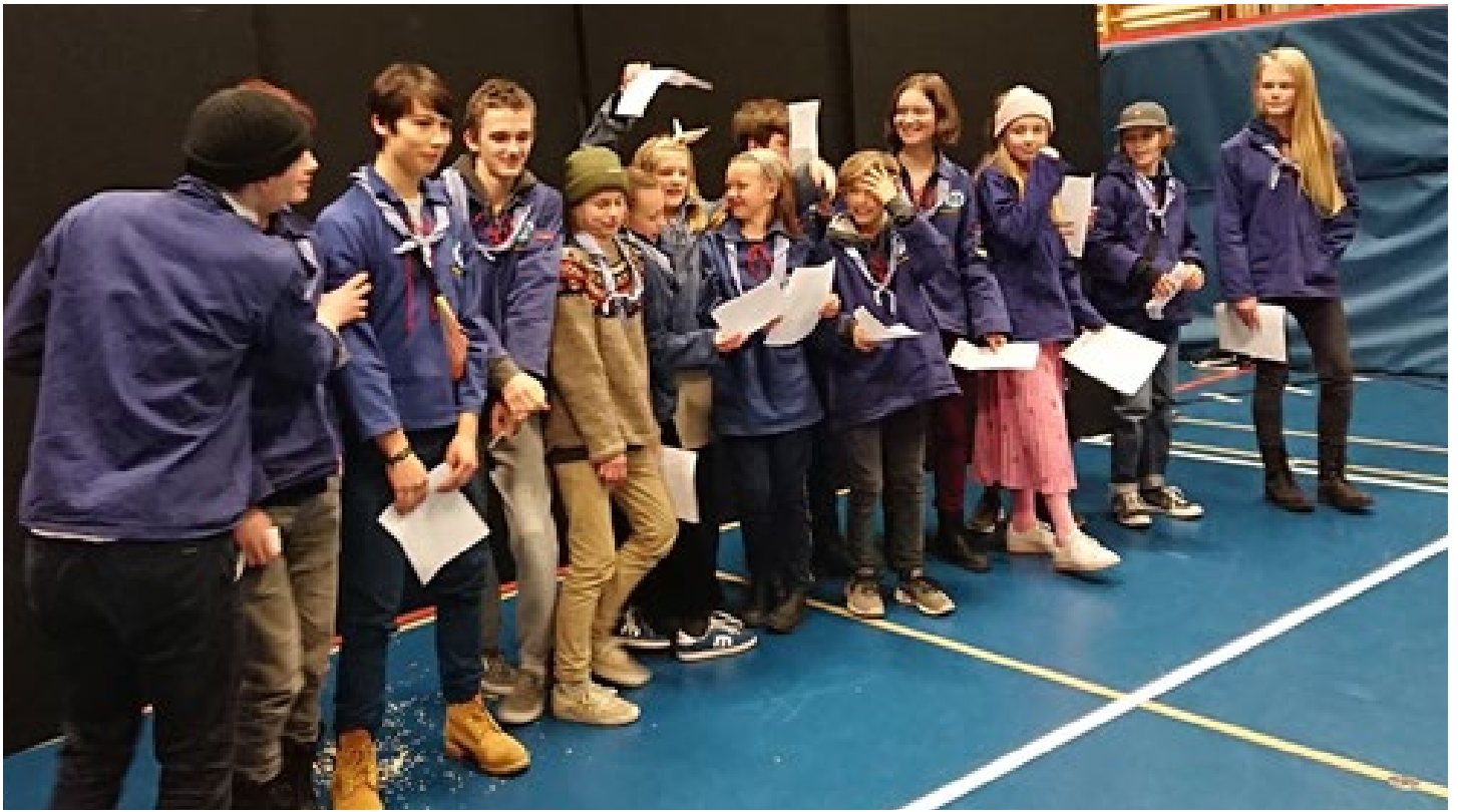
Troppens underholdning til banko: "Alle sømænd er glade for piger" udsat for skønsang.