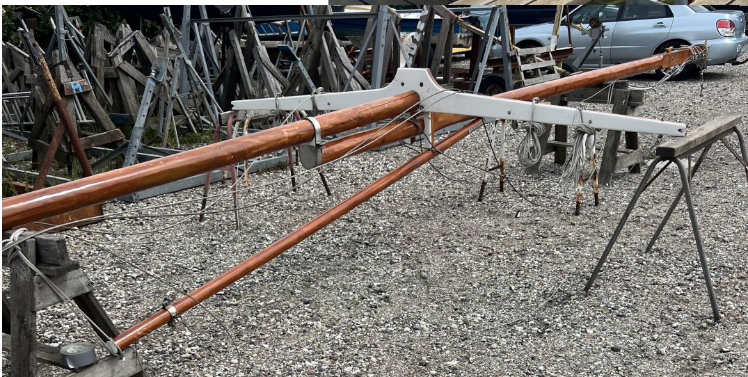
GRY's nedlagte flagmast , der skal have en kærlig overhaling