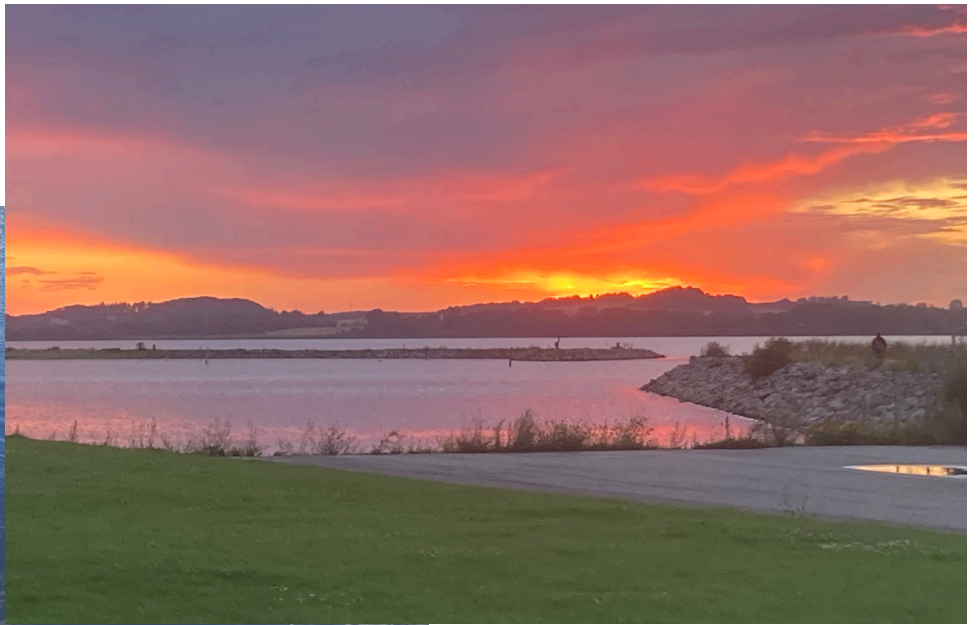
Aftenudsigt over Holbæk Havn.