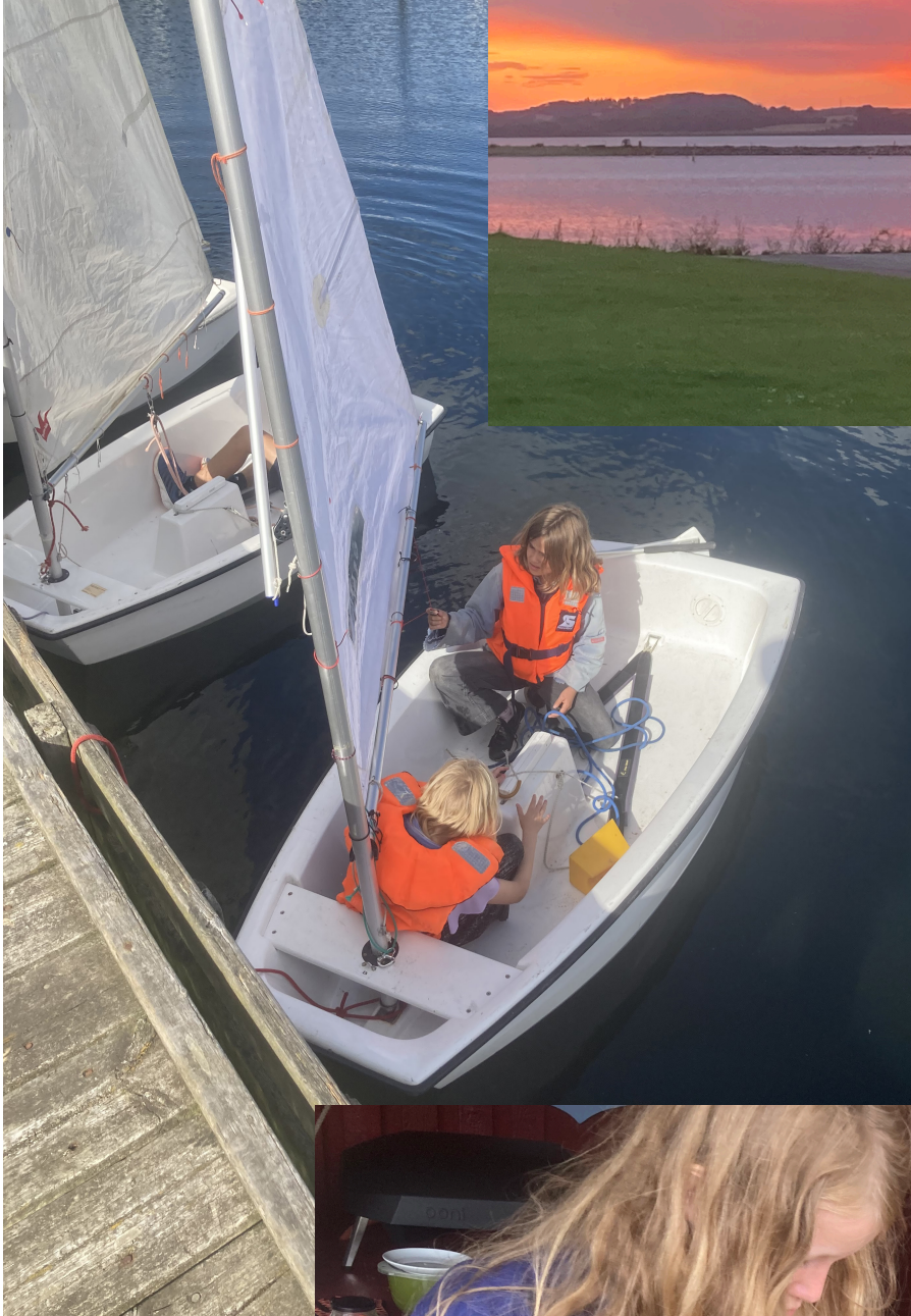
Zoe og Mynte gør klar til sejlads.