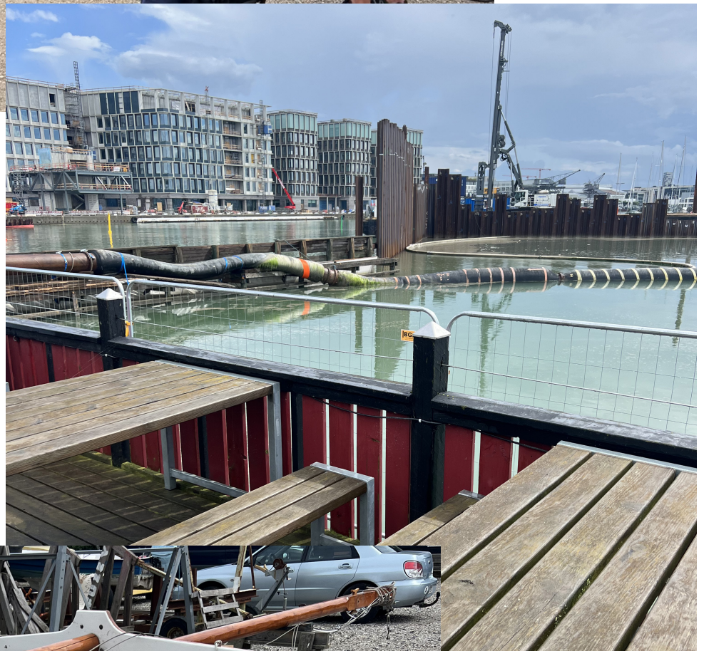
I Svanesøen er de snart færdige med at spunse i forbindelse med tunnelbyggeriet.