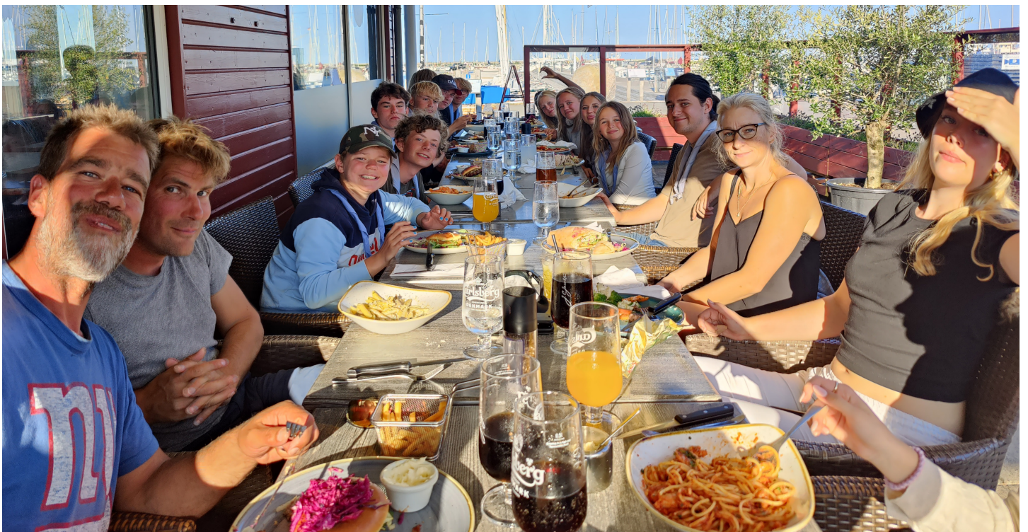
Os alle samlet til lækker mad den sidste aften på sommerturen.