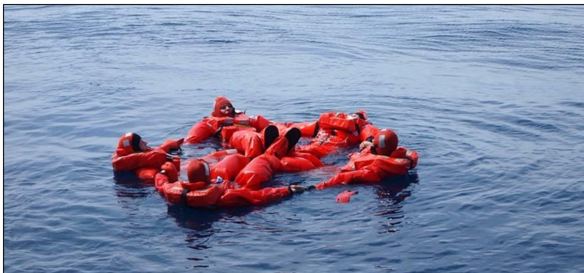
Evakueringsøvelse udenfor Madeira / Skoleskibet Danmark (se mere s.9)