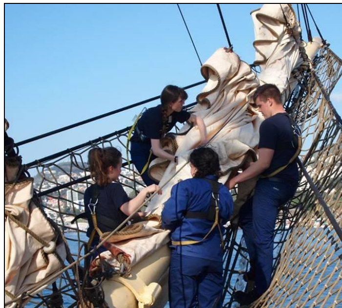
Sejlene pakkes sammen ved ankomst Madeira