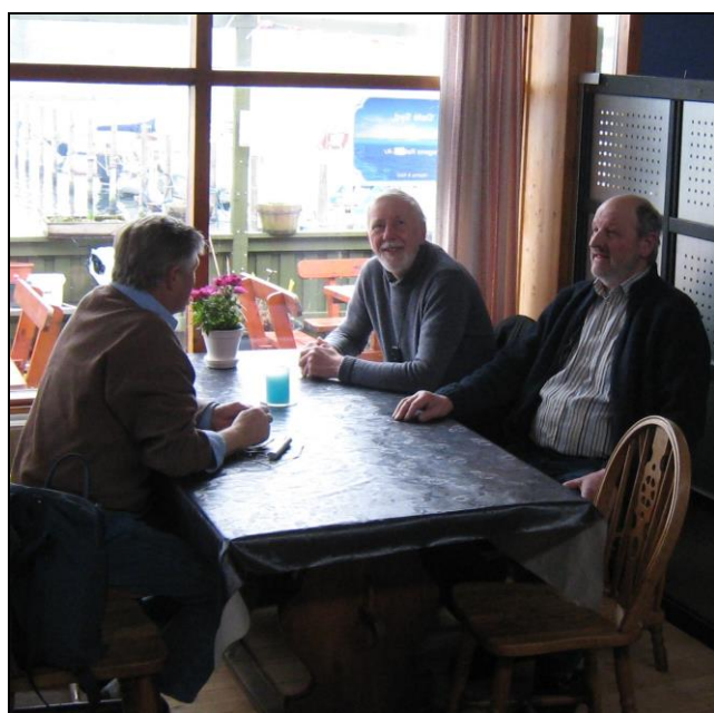
Flere sølulke om et bord ☺