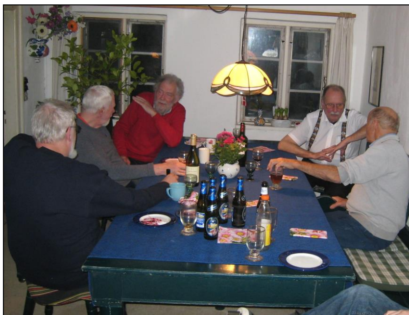
Sølulke omkring et bord