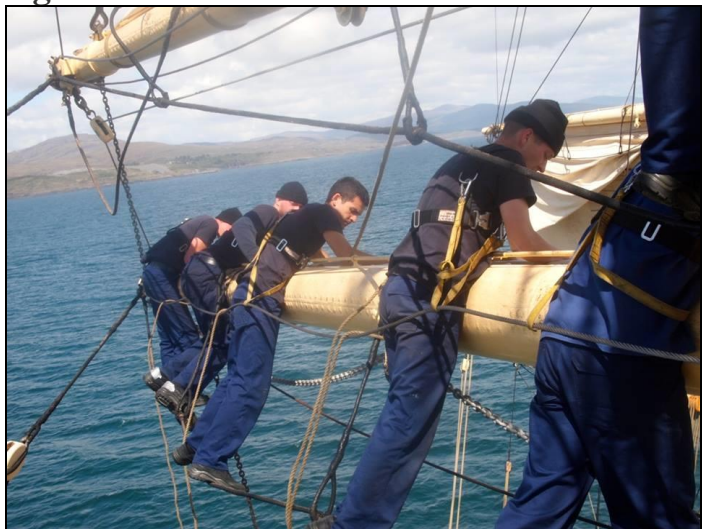
Sejlene stuves før opankring i Bantry Bay

Siden Brasilien har 'Danmark' aflagt besøg på Azorerne og i Bantry Bay på Irlands sydvestkyst.