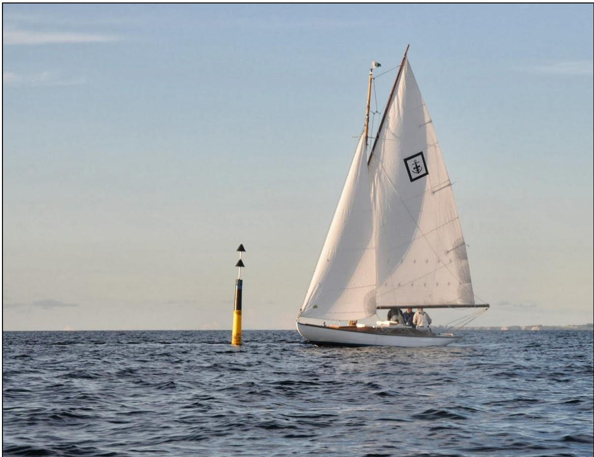
Chresten K i fin vind