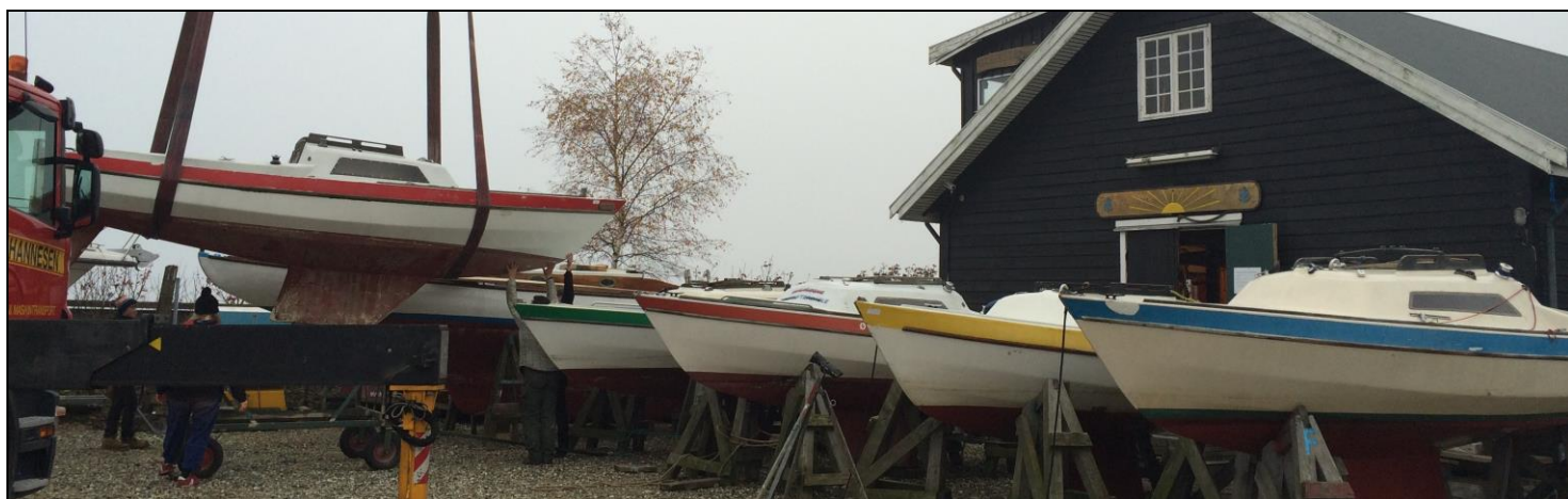
Spejderledere på arbejde