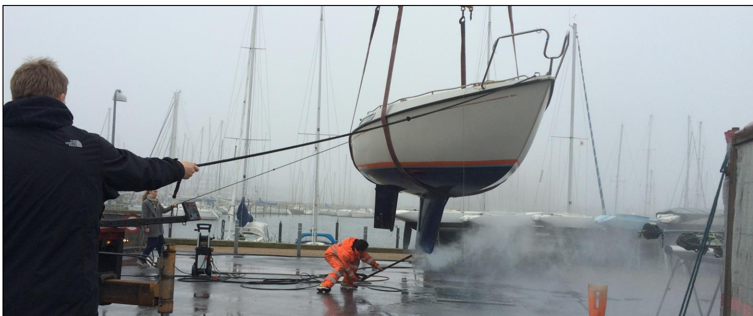
Jungmænd på arbejde