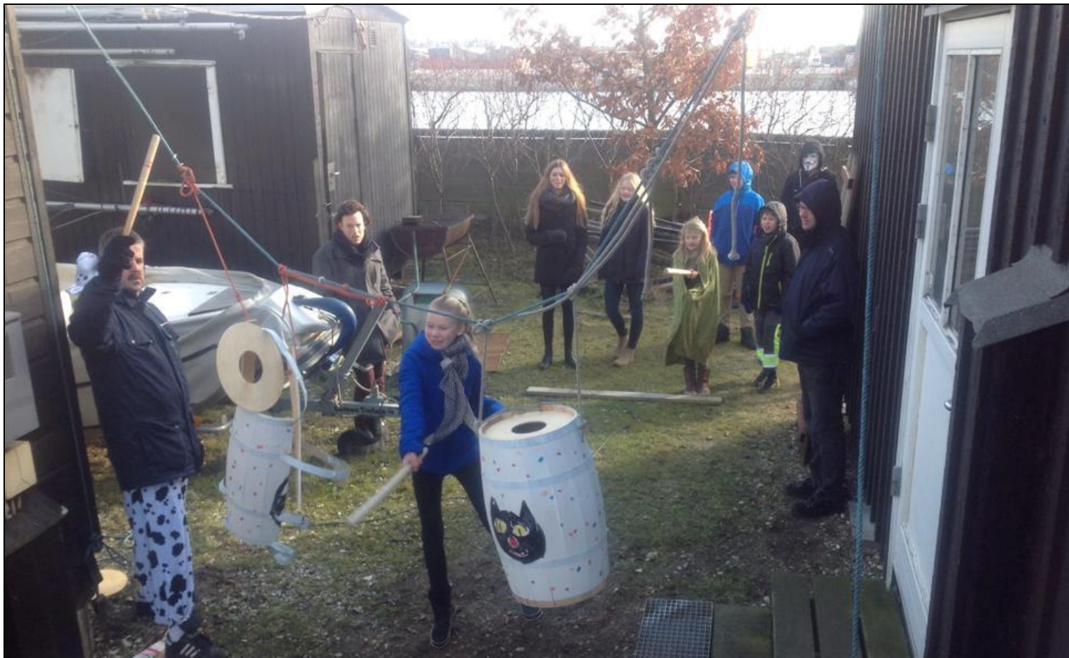
Endnu en gang blev katten slået af tønden til fasteavn i Gry!