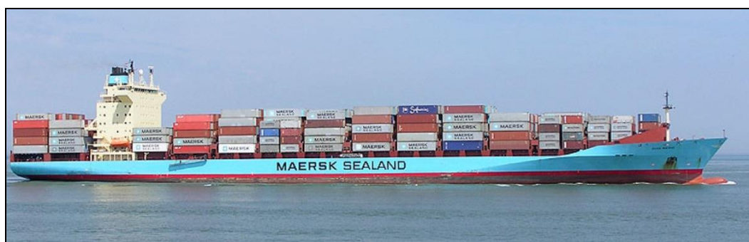
Olga 1, 2 og 3

Og så er der lille Olga Wayfarer – se næste side