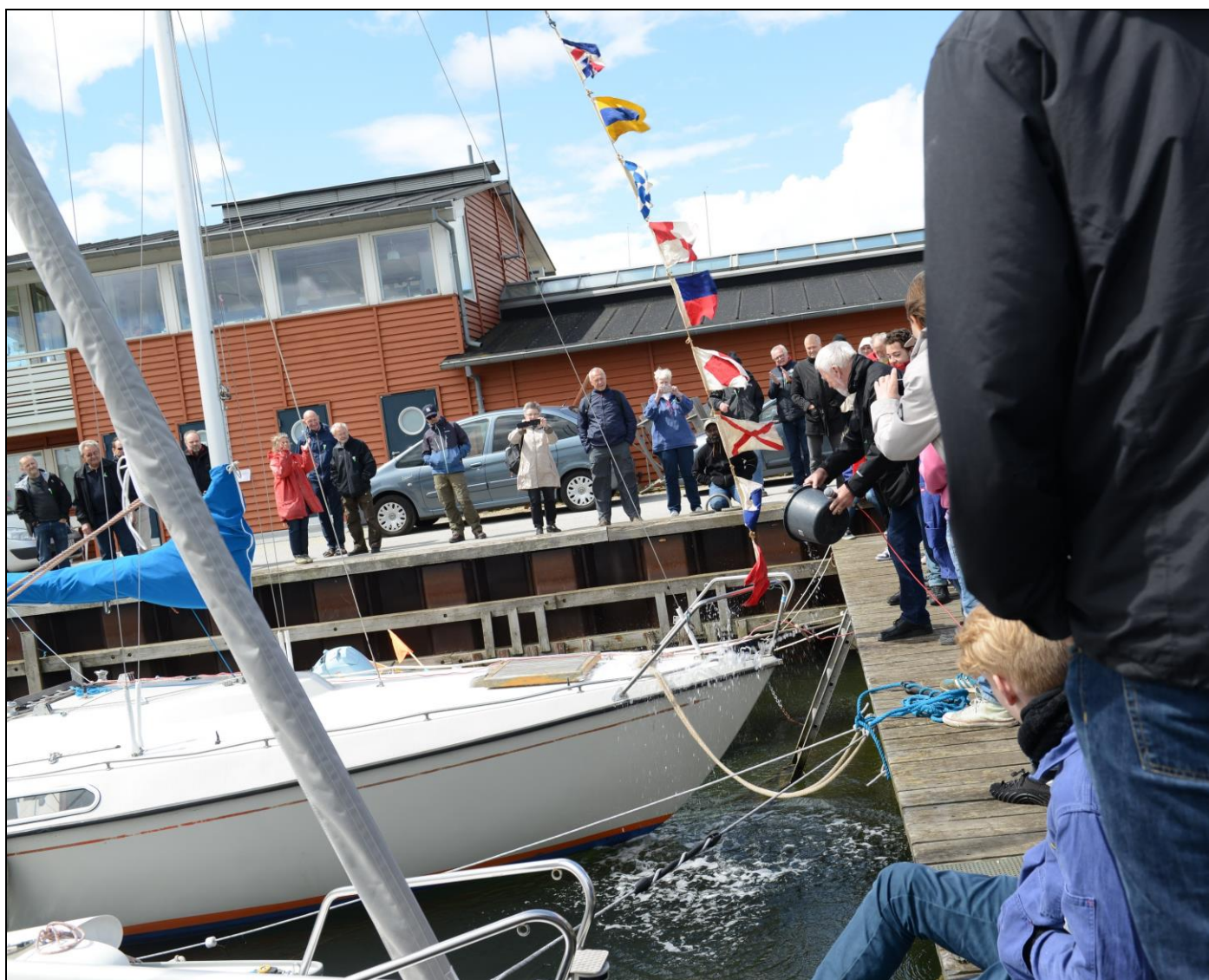
Phao døber Chronicle