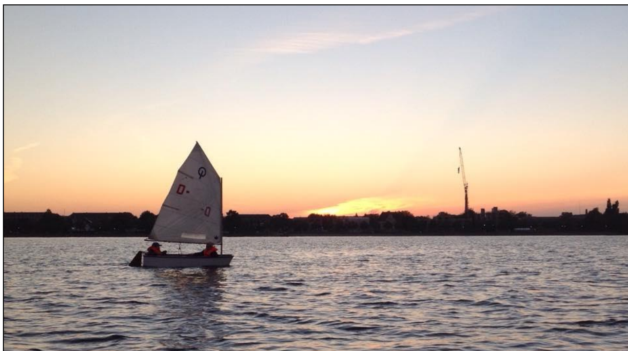
En af de sidste aftener på vandet i denne sæson