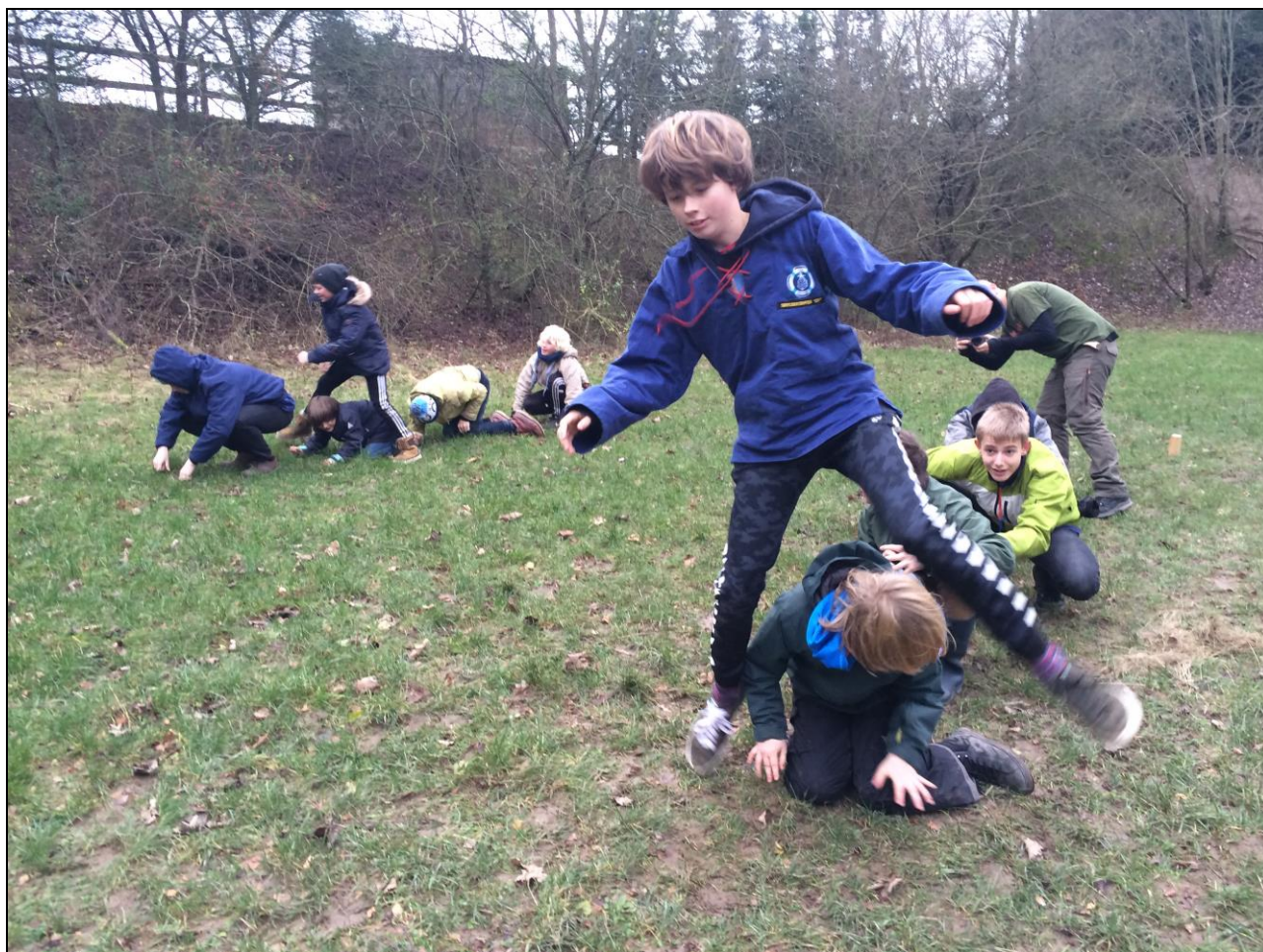
Frøhop på årets juletur.