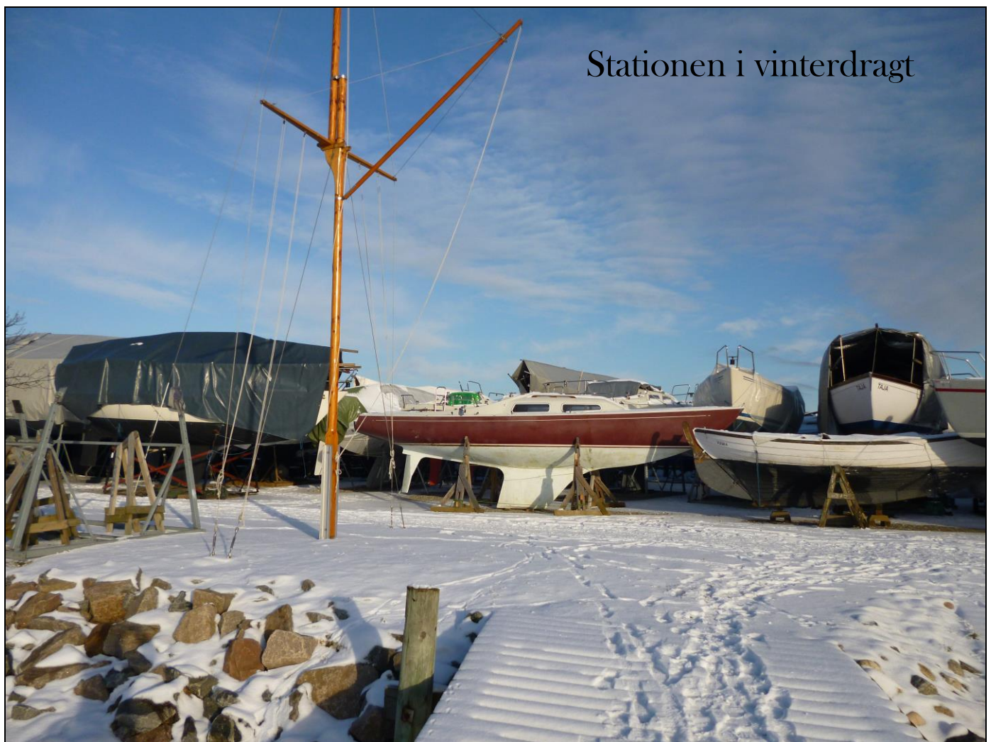
Stationen i vinterdragt

Husk Grupperådsmødet d. 25. februar Grupperådsmødet er Grys 'Generalforsamling' se den vedlagte invitation ☺