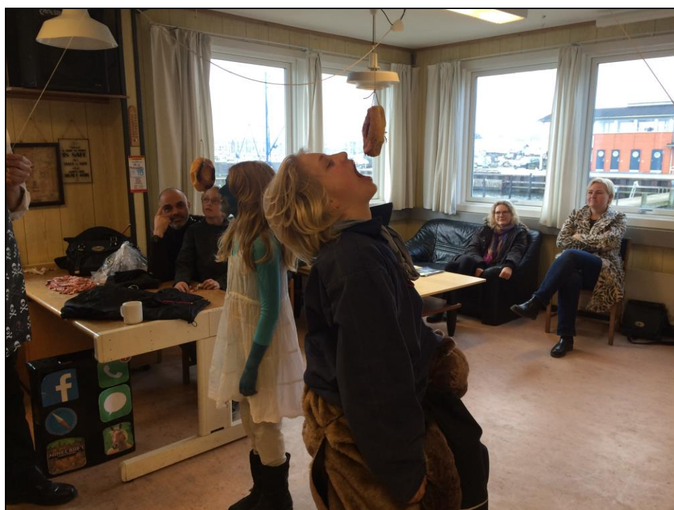
August: Sulten og hurtigste fastelavnsbollespiser.