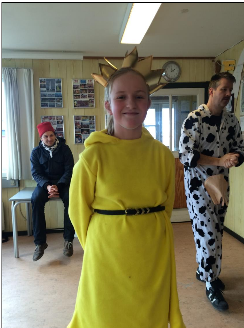
Atlanta: Kattedronning og kattedronning på én gang.