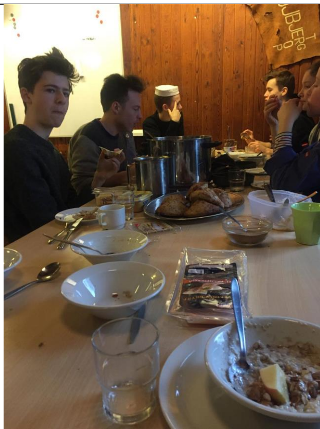
Leg og Luxusbrunch på Ørholm!