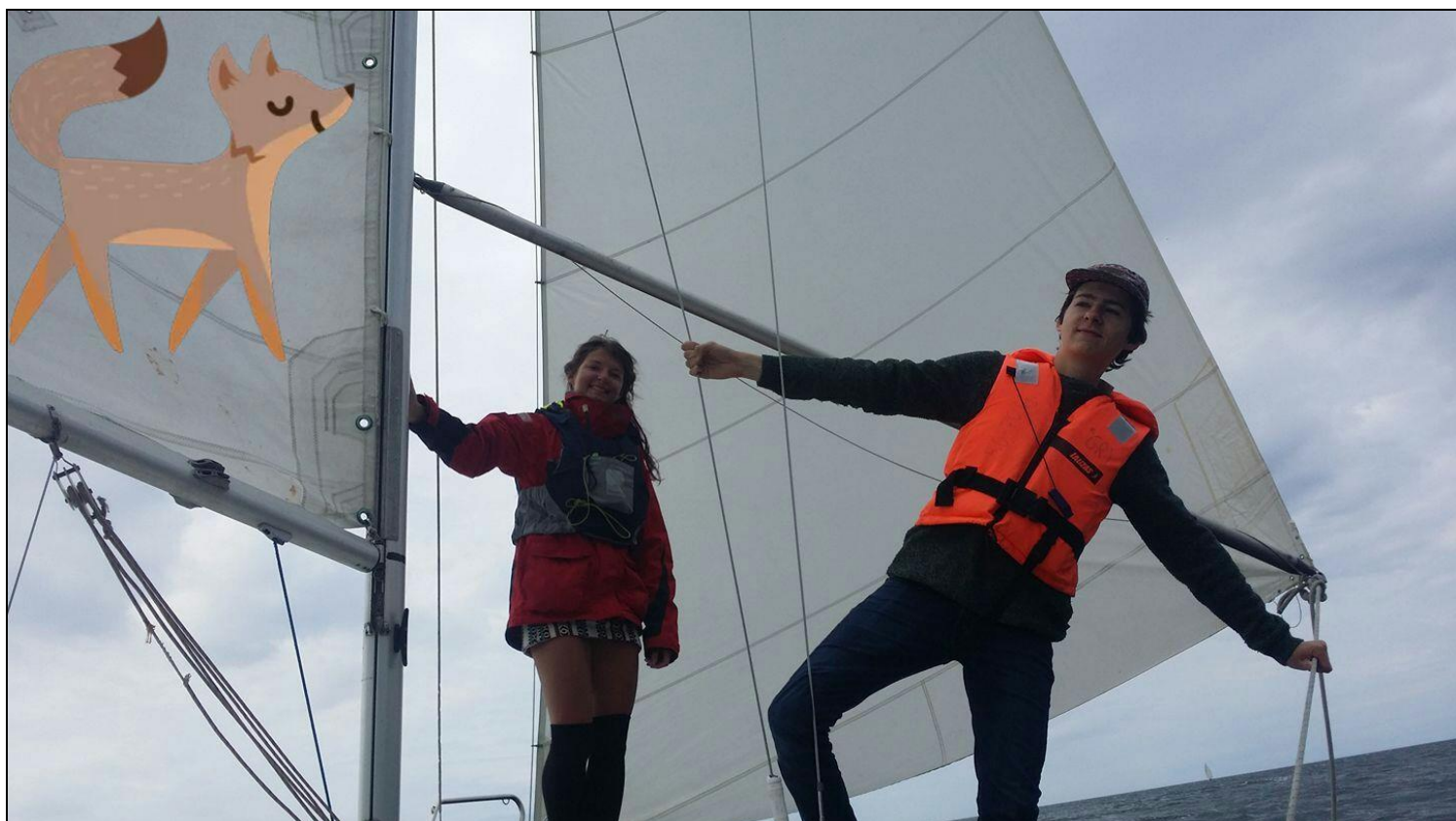
Jungmænd på sommertur ...