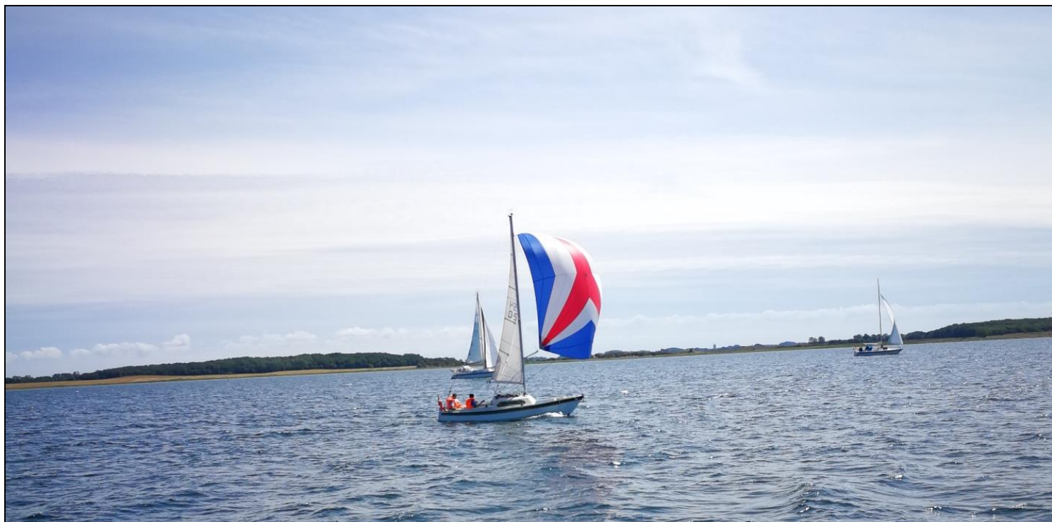
Spejdere på sommertur ...