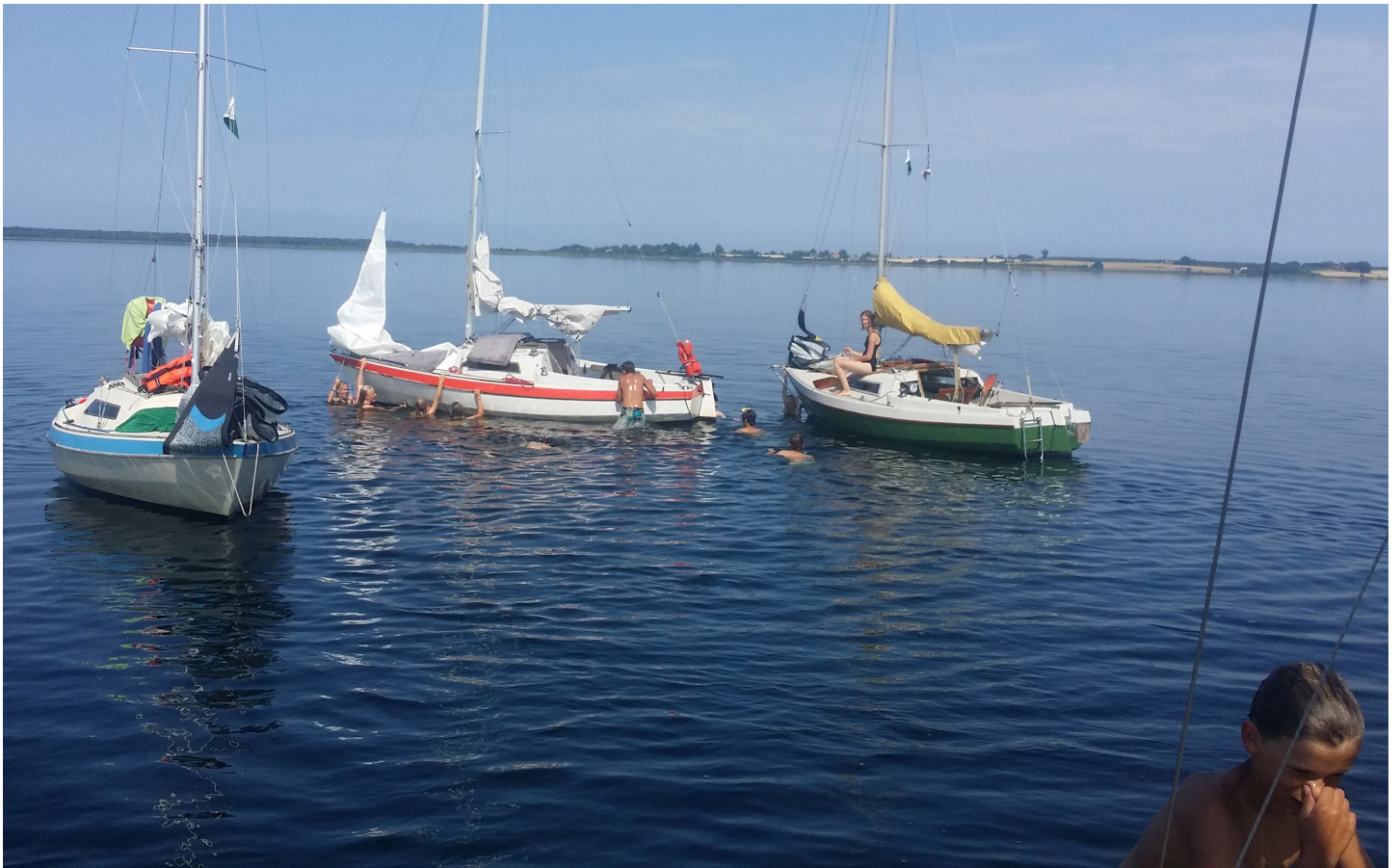
To ugers sommertur med det bedste badevejr i umindelige tider!