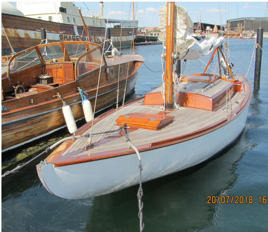
Maage nr. 6, PUK.