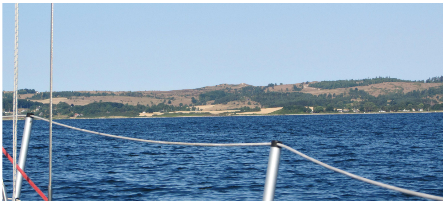
Lettet med Adesso fra Ebeltoft, kurs 280°. Mols Bjerger i stævnen.