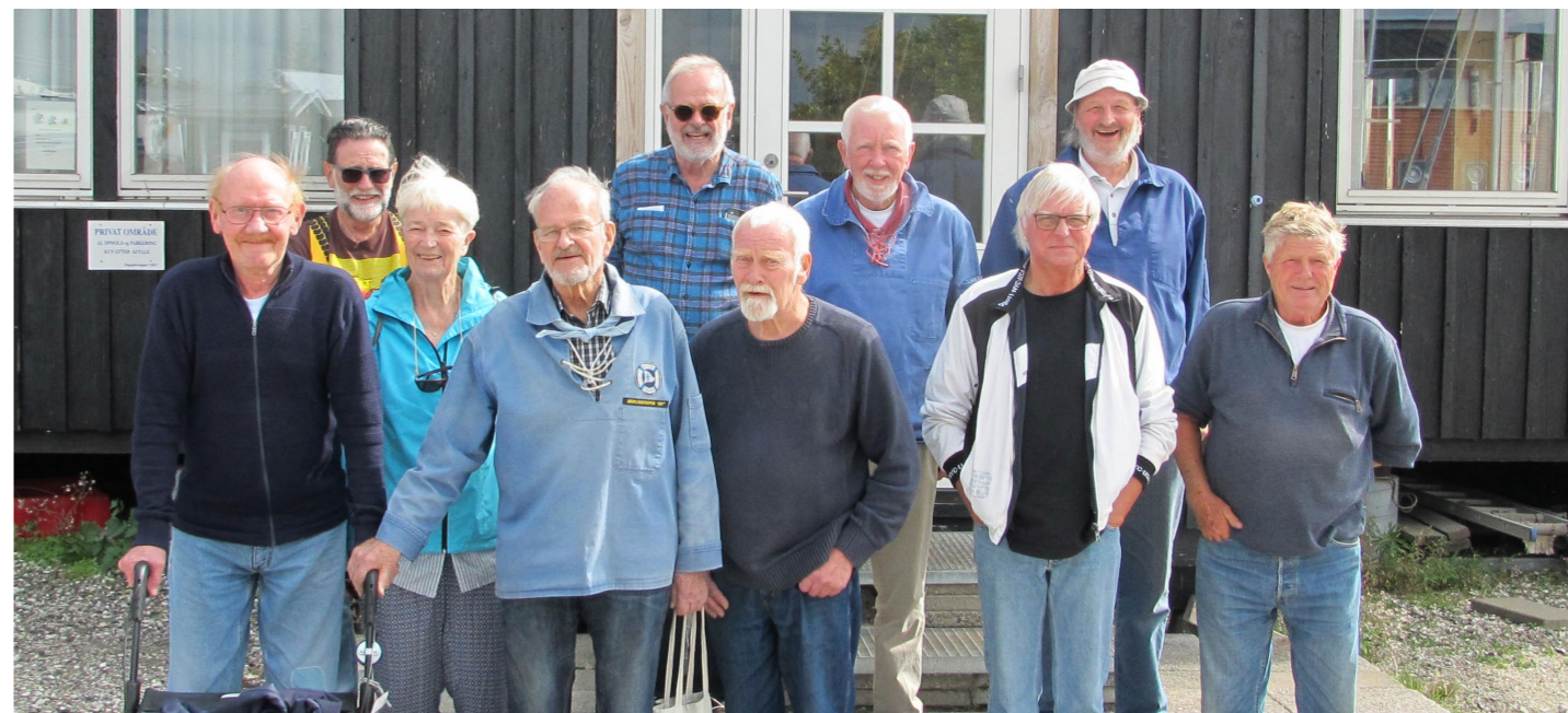
Deltagerne i Admiralforsamlingen 2018