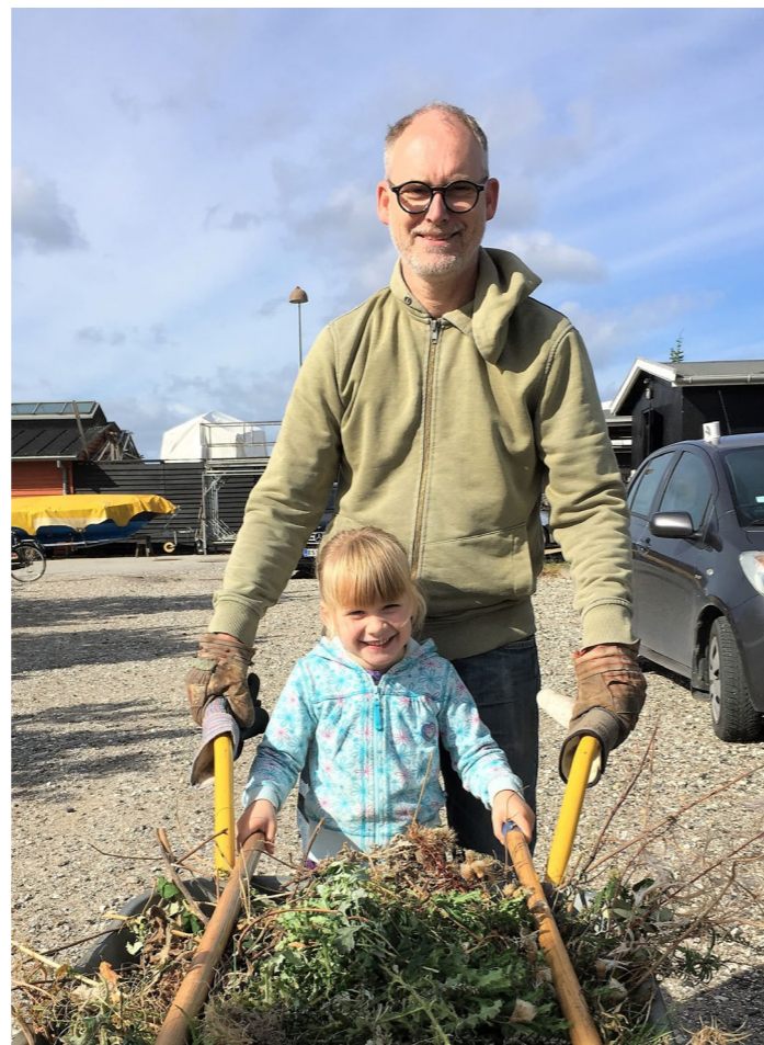
På havearbejdet hjælpes man også ad.