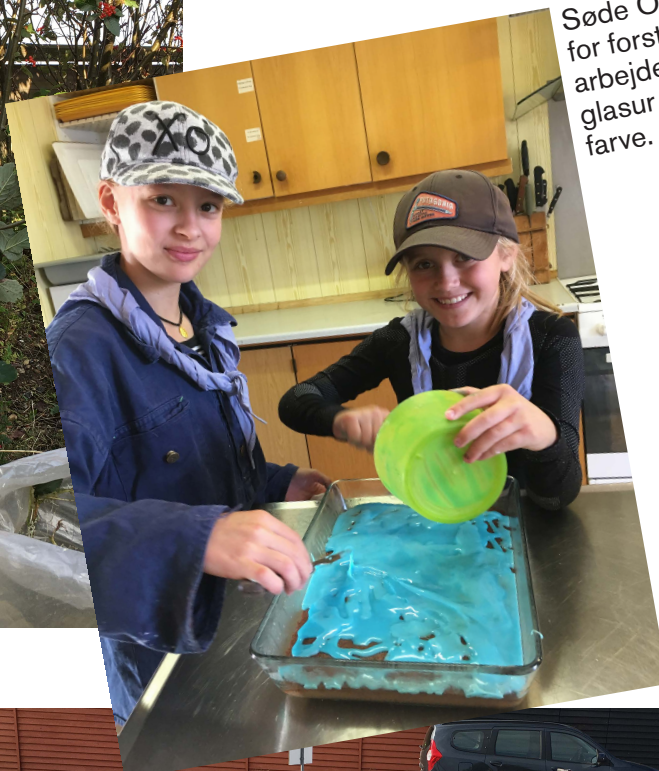
Søde Ooptier sørger for forstærkninger til det arbejdende folk med glasur i reglementeret farve.