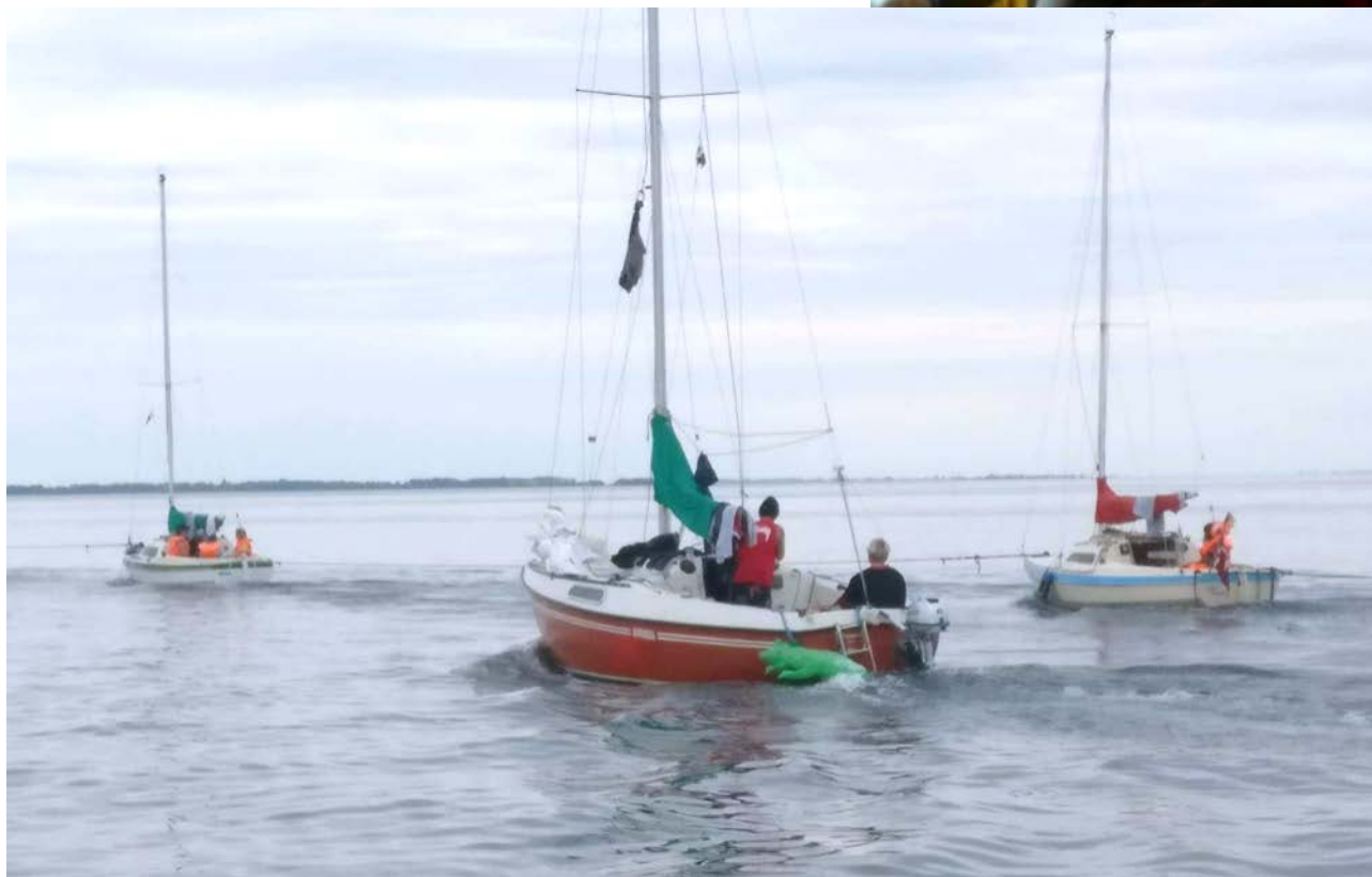
Fra venstre mod højre: Kaos, Antares, Kiwi