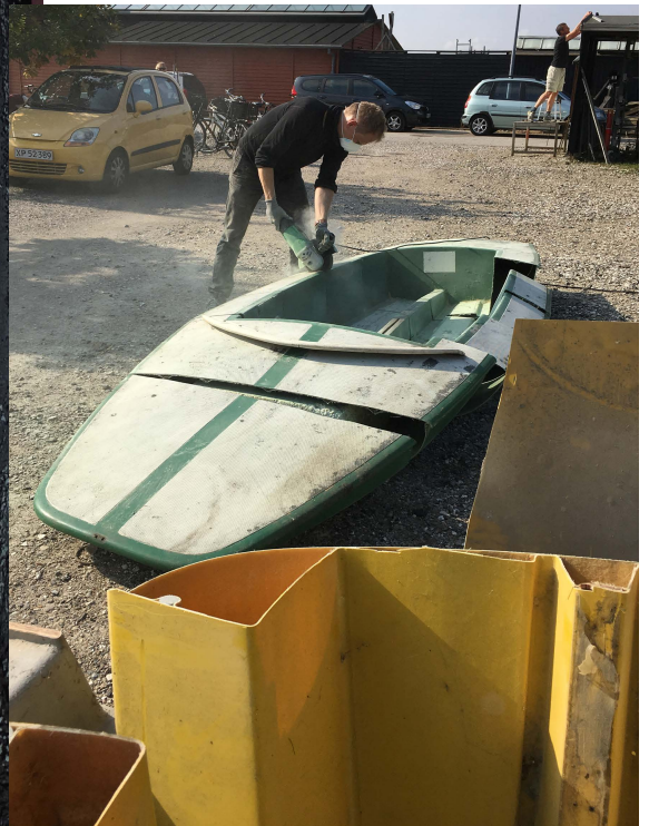
Et vemodigt syn: udtjente laserjoller saves i stykker for at kunne afleveres på lossepladsen.