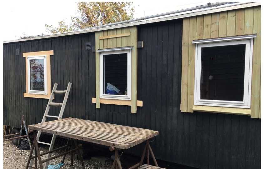
Der er kommet nye vinduer i Mellemstationen.