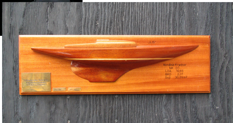
Chresten K. har vundet indtil flere præmier i kutter/platgatter-løbene.