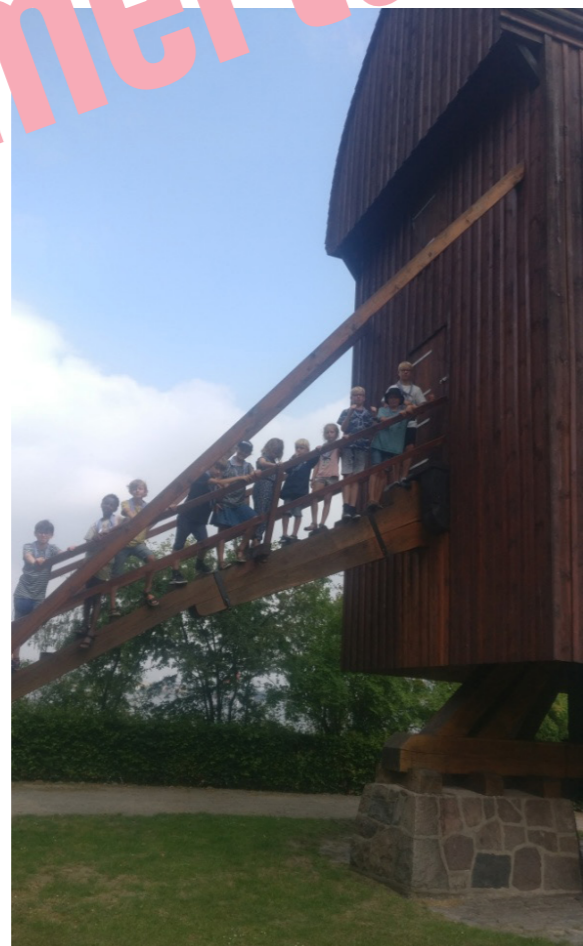
Ooptibesøg ved mølle.

Spejdere ombord i Pollux i Falsterbokanalen – og så i solnedgang. Smukt.