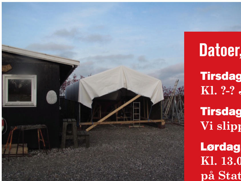
Chresten K. i sit vinterhi.