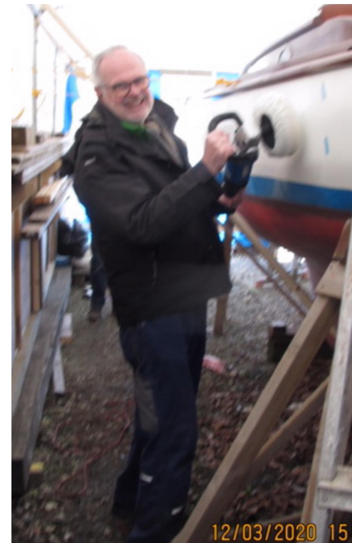
Der bliver poleret, så det hele ryster. Selv fotografen.