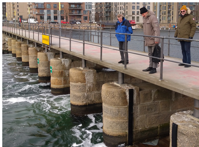
Studietur til Sluseholmen , kolde søulke studerer slusen.

kl. 13. Standerhejsning. Blankpolerede sko, slips og tørklæde.