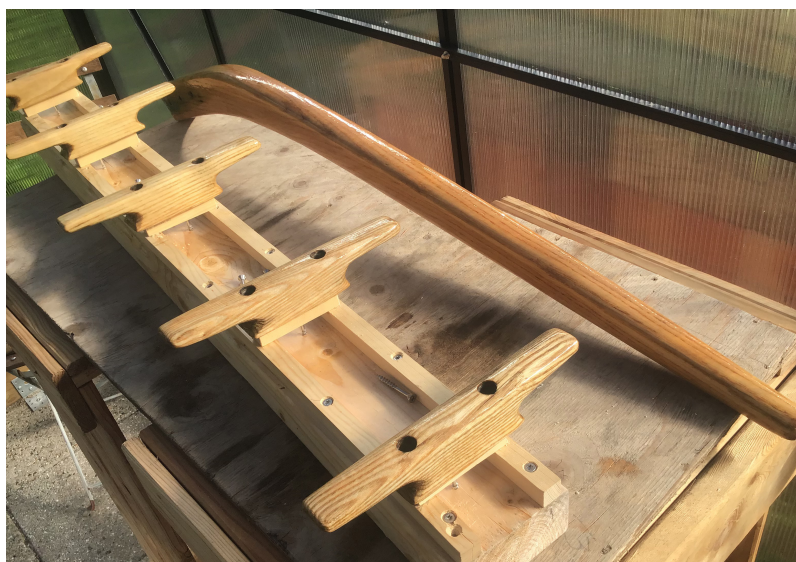
Klamper til falder m.m. samt rorpind er renoveret og lakeret syv gange.