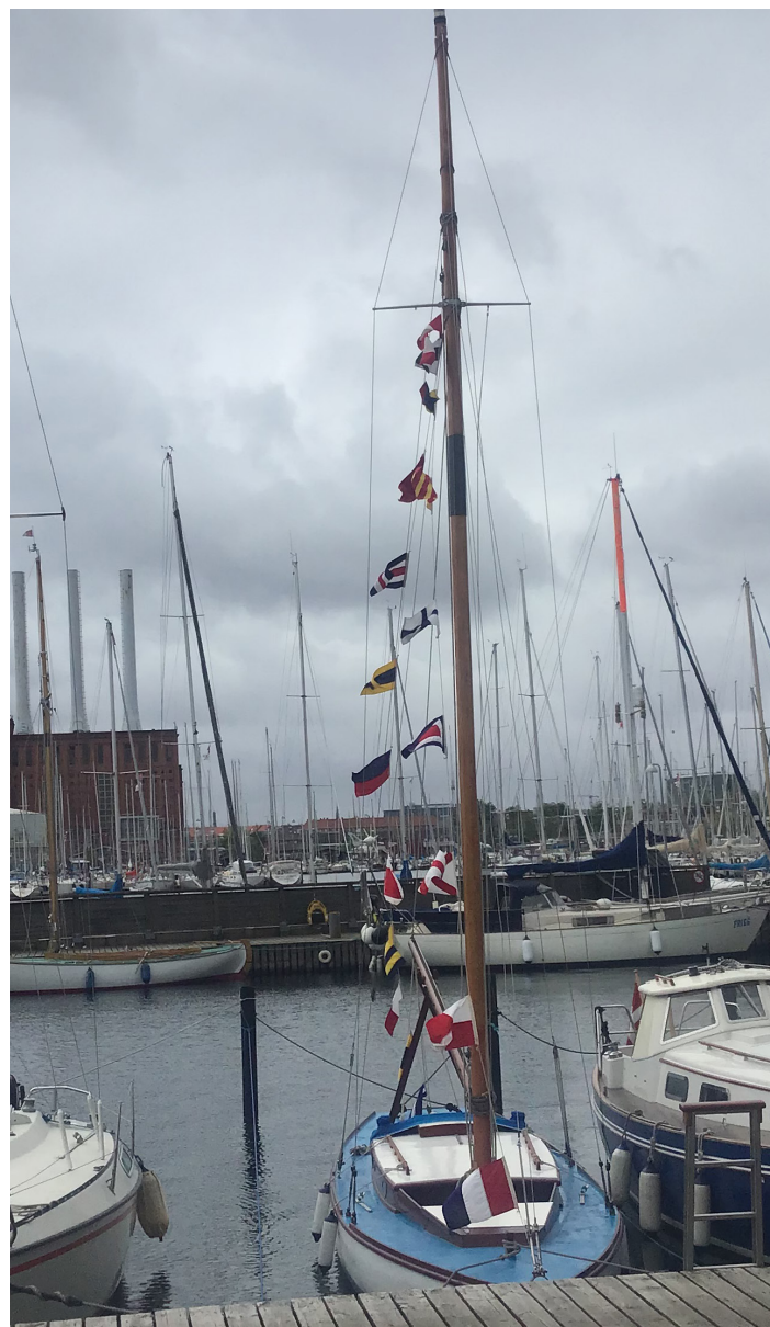
Flag over top – næsten – på Chresten K, ved Standerhejsningen den 21. maj.