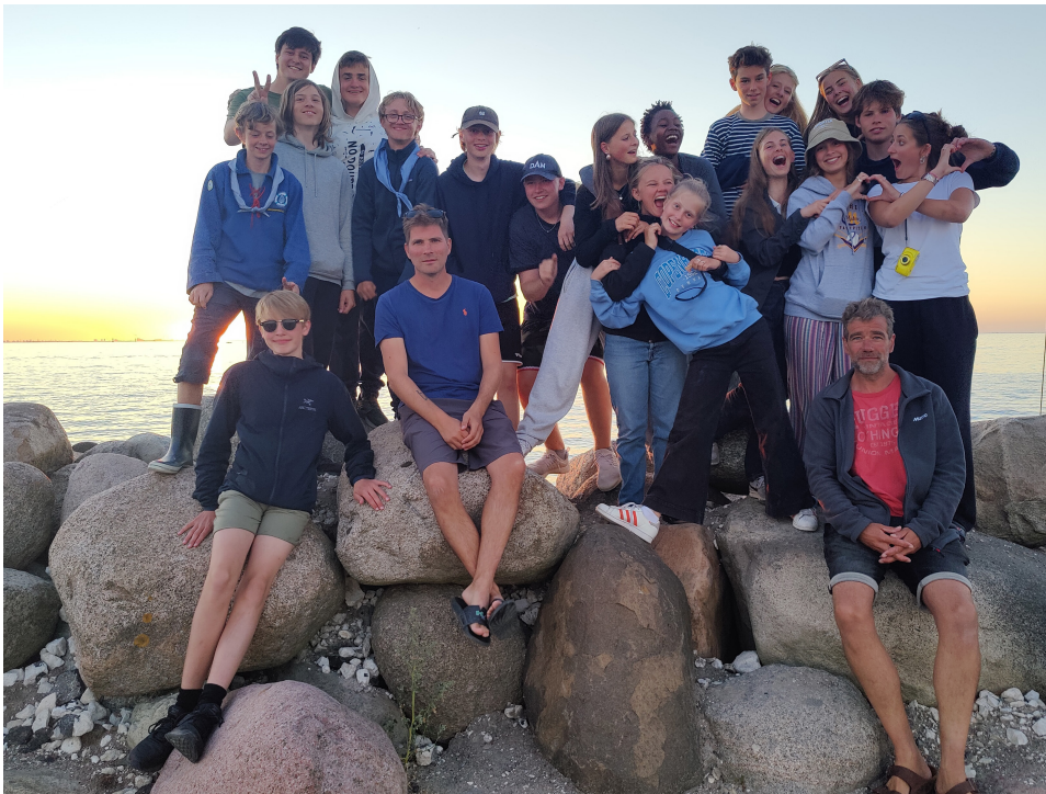
Tropfen i solnedgang over Limhamn.