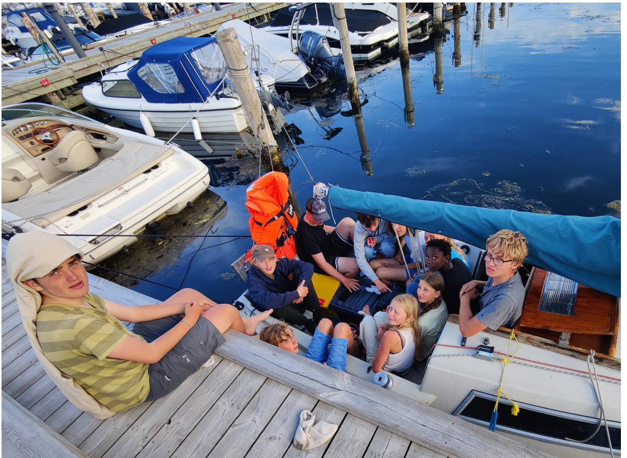
Fælleshygge ombord på Banana Joe i Skovshoved Havn.