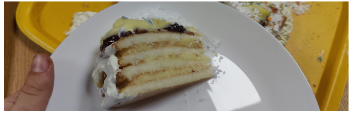
Så skulle der smages. Mon det var den med hakkede løg?