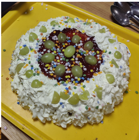
Det ene resultat...