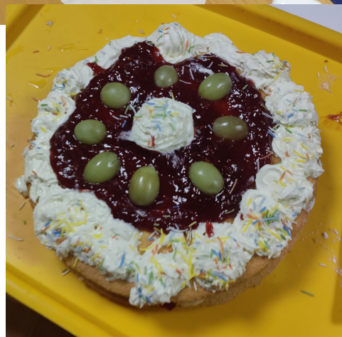
... og det andet.