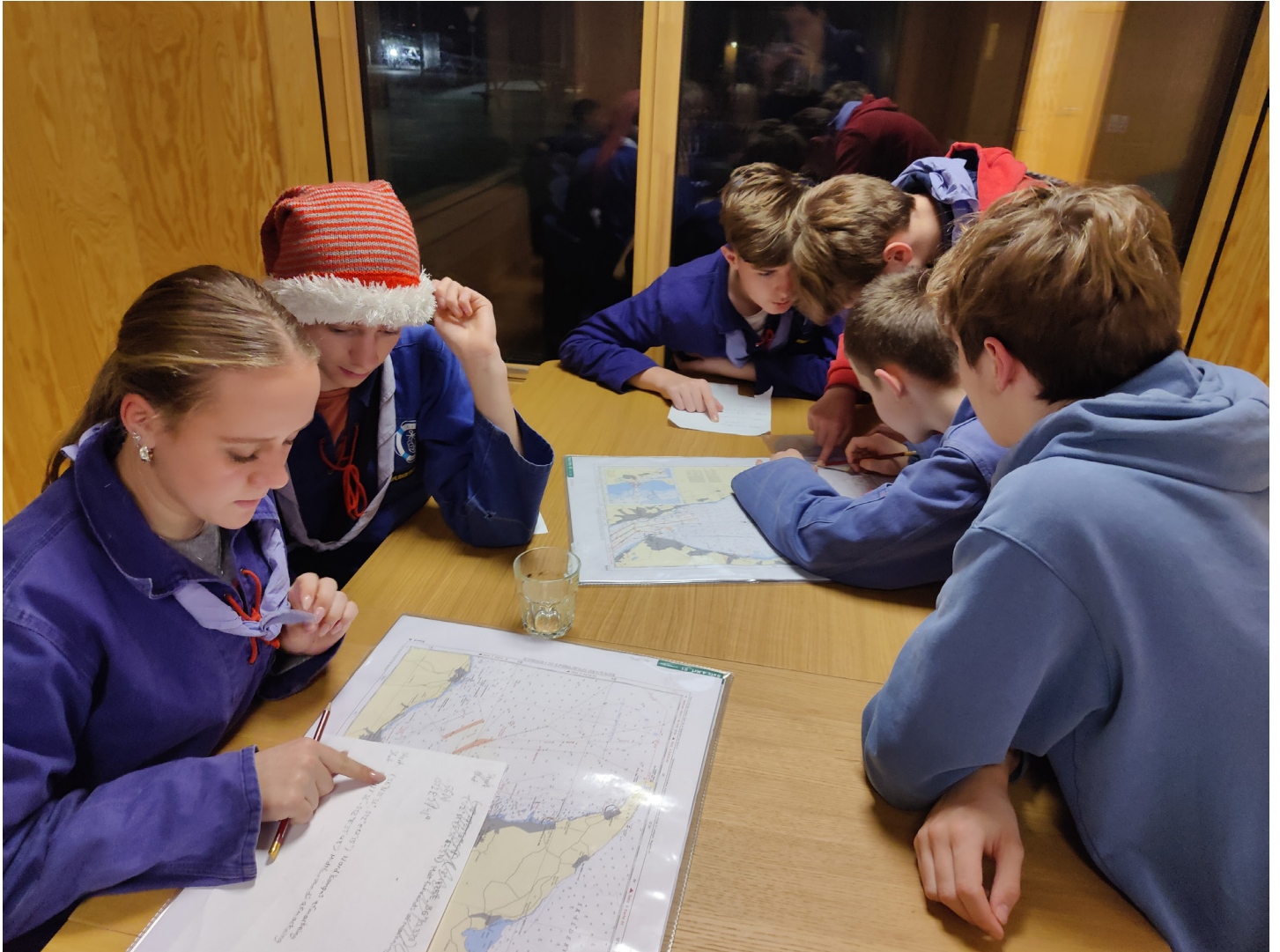
Delfinen og Havørnen har fået to koordinatsæt og skal finde kursen mellem dem.