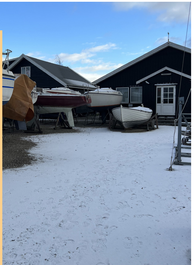
Der var hvid jul ved middagstid den 24. december på Stationen.